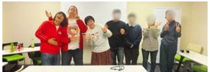
お笑い芸人と物語を作る企画の様子

その結果、日常では交わることの少ない世代同士が、言葉を探す過程で共通点を見つけ、自然なコミュニケーションが生まれました。教える・教えられる関係にならず、同じ目線で関われるのは文芸ならではのです。助成金をきっかけに、多世代がゆるやかにつながる新たな挑戦が実現しました。