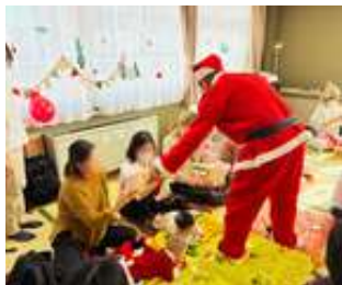
親子ミニデイ「いつでもおいデイ」