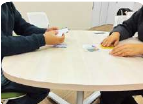
かるたイベントの様子

「 社会教育・福祉・文化（振興） 」の3軸を大切に、地域との関わりが少ない人も参加しやすい場を目指しています。