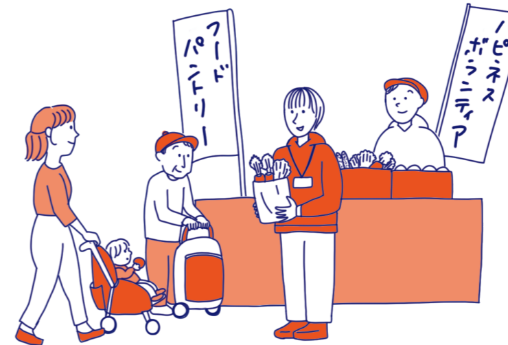
お店や活動団体が食品を持ち寄って、 子育て世帯や高齢者世帯に食料を配布する