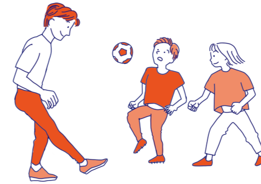
学生や若い世代が勉強を子どもに教えたり、 スポーツと一緒に楽しむ