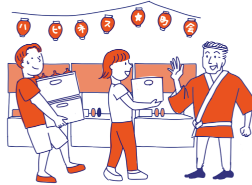
コミュニケーションは苦手だけど、体力には 自信がある若者が、参加する