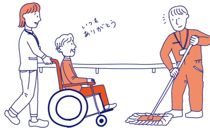
生きづらさのある人に、 掃除などの就労体験の場を提供する