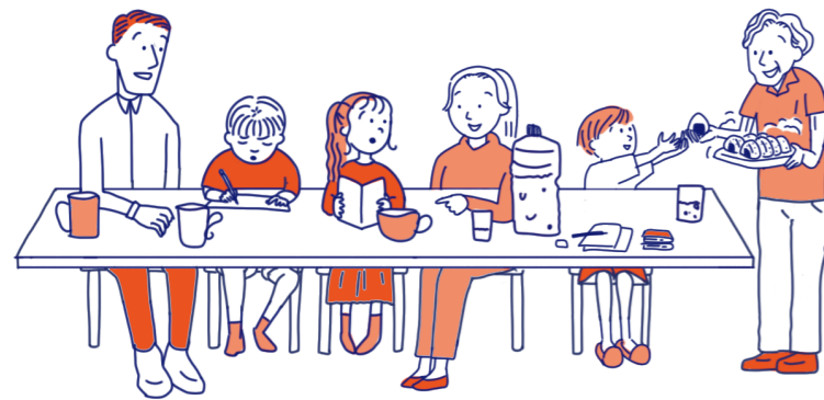
学習支援団体と会食会の団体がコラボレーションして、 地域の子どもの居場所をつくる

「人が集まる楽しい場をつくりたい」「団体同士がつながってあんなことができたらいいな」 あなたの関心から、あなたの気になることから、NAKANOのつながりを広げていきませんか？