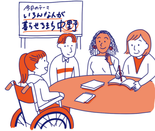
多様な人が、まちづくりの話し合いで、 誰もが過ごしやすいまちにするため意見を出す