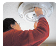
電球の交換など高齢者のちょっとした困りごとを解決する単発のボランティア活動

日時 2024年7月3日(水) 午後6時30分~7時30分 定員 10名 場所 スマイルなかの3階 AB会議室(中野5-68-7) 申込み Googleフォームにて受付します。 URLを入力するか二次元コードからアクセスできます。 https://forms.gle/YmfVz11GhELSDM3WA