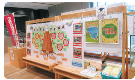
5月12日の「民生委員・児童委員の日」に合わせて区役所新庁舎1階でパネル展を実施

民生委員・児童委員は、身近な相談相手として、必要な支援のため関係機関へのパイプ役を担っています。誰もが安心して暮らせる地域づくりのための様々な活動内容を周知するため、パネル展を新区役所1階と夢通りに行いました。